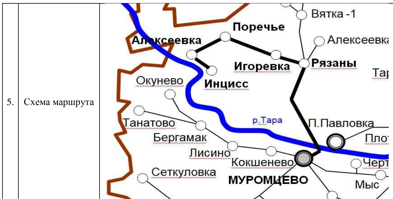
6. Графики движения (выходы) транспортных средств: